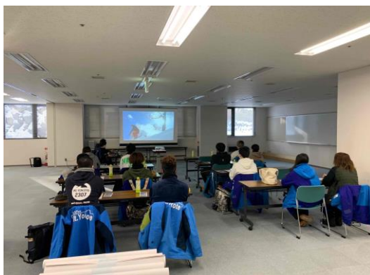
索道従事員新人研修会

当社では、輸送や皆様の安全に役立つよう、施設及び取扱についての安全教育を実施しています。