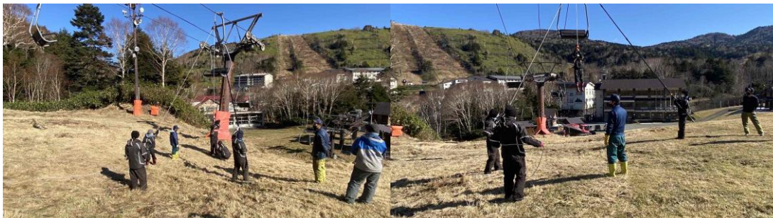
職員による緊急時の対応訓練状況